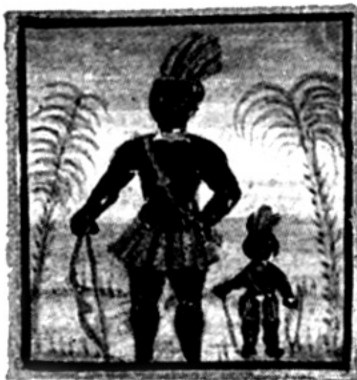
ברוך משנה הבריות, מתוך כתב יד 'סדר ברכת המזון עם ברכות הנהנין', וינה 1740

וכי ניתן בהחלט להתגבר עליה, בכלים טיפוליים מתאימים בשילוב אמונה דתית. זהו הארגון היחיד שנתמך על ידי רבנים, ולכן זוהי הכתובת היחידה הקיימת עבור ההומוסקסואל הדתי, בחיפוש אחר תשובות לשאלותיו (כל גולש באינטרנט שיקליד במנוע חיפוש ישראלי את המונח 'הומוסקסואליות' - יגיע מיד לכתובת האתר, מן הראשונים ברשימה שמתקבלת). מאמר זה ינסה לבחון את האופן שבו מתמודד הארגון עם הנושא, וינסה לדון ביתרונותיו