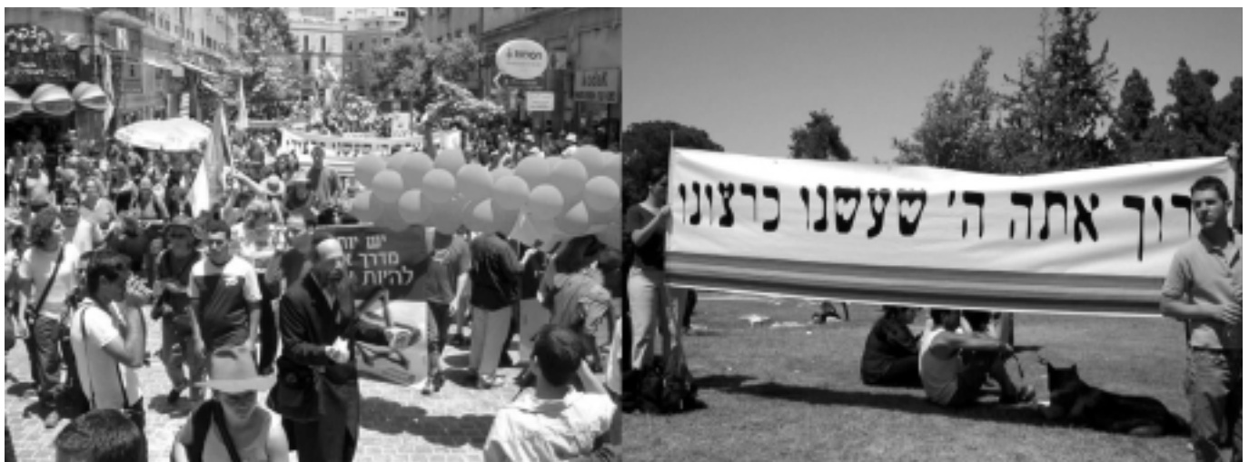
מצעד הגאווה, ירושלים 2003

מדובר בתופעה הקיימת בקרב כל העמים וכל התרבויות לאורך ההיסטוריה – מיוון העתיקה ועד מצרים, מן האינדיאנים ועד איי האוקיינוס השקט – הנטייה קיימת בקרב אחוזים אחדים